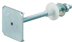
WDP - Крепеж для раковин