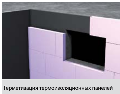
Герметизация термоизоляционных панелей