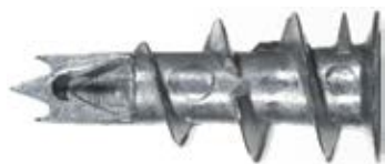
Металлический дюбель для гипсокартона GKM