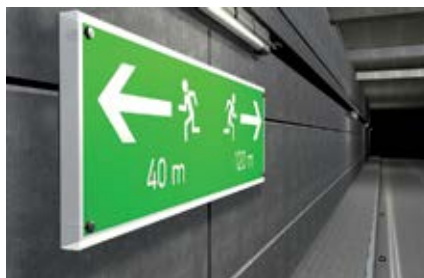
Знаки аварийного выхода в туннелях