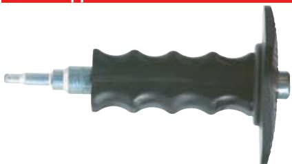
Установочный инструмент FZED plus