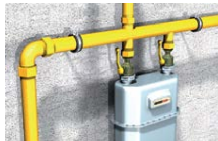
Крепление газовых расходомеров