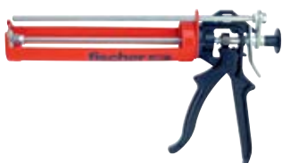
Выпрессовочный пистолет FIS AM