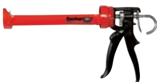
Выпрессовочный пистолет KPM 2