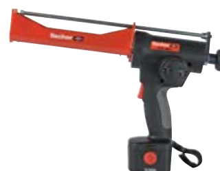
Аккумуляторный выпрессовочный пистолет FIS DC 4000 S