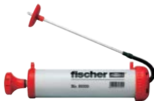
Продувочный насос ABG