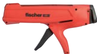
Выпрессовочный пистолет FIS DM S