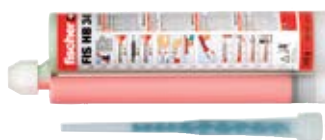
Инъекционный состав FIS HB 345 S + статический миксер FIS S