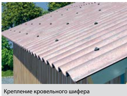
Крепление кровельного шифера