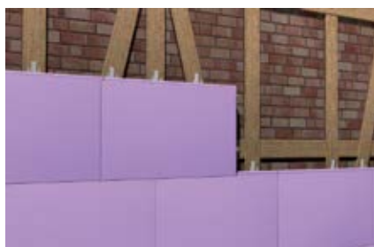
Прочные на сжатие термоизоляционные панели в деревянных подконструкциях