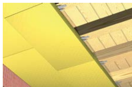
Прочные на сжатие термоизоляционные панели при креплении к потолку