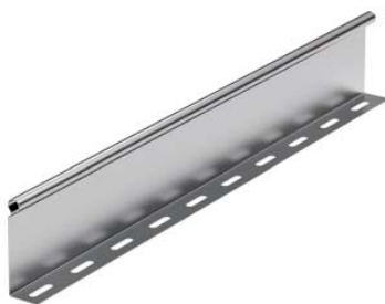
Перегородка высотой 50–80 мм