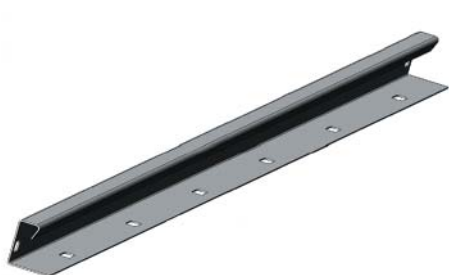
Перегородка высотой 30 мм