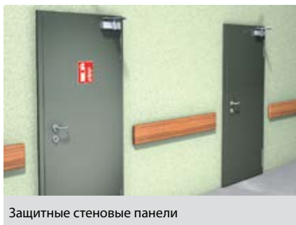
Защитные стеновые панели