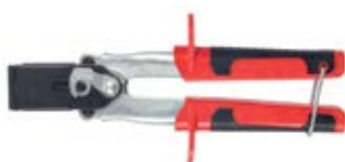
HM Z 1 – профессиональный монтажный инструмент