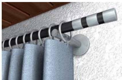
Карнизы для штор