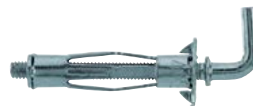
HM-H с крюком