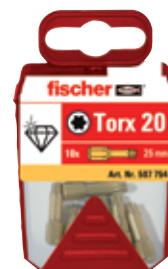
Биты FDB в пластиковом контейнере