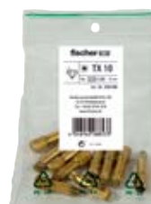
Биты FDB в полиэтиленовом пакете