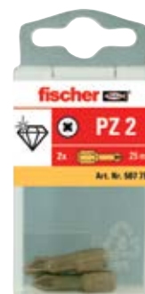
Биты FDB в пластиковой упаковке