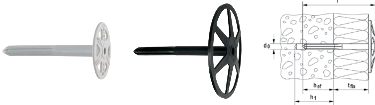
Дюбель для термоизоляции ДНК 45 , диаметр тарелки - \varnothing 45 мм