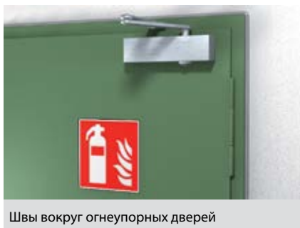
Швы вокруг огнеупорных дверей