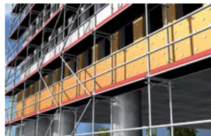
Прочные на сжатие изоляционные материалы в навесных фасадах