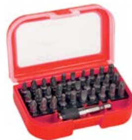
Набор бит FPB, 31 предмет