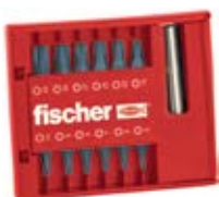
Набор бит FSB из нержавеющей стали, 13 предметов