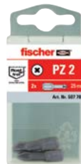
Бита из нержавеющей стали FSB в пластиковой упаковке