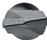
Бур SDS Plus II Pointer