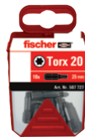
Биты Profi-Bit FPB в пластиковом контейнере