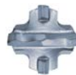
Наконечник бура ø 18 мм