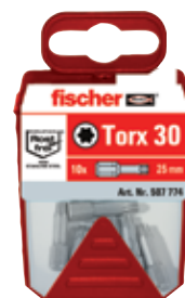
Биты из нержавеющей стали FSB в пластиковом контейнере