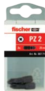
Биты Profi-Bit FPB в пластиковой упаковке