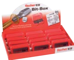
Набор бит FPB, 31 предмет в упаковке Display по 12 штук