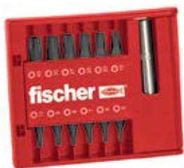
Набор бит FPB Profi, 13 предметов