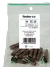
Profi-Bit FPB в полиэтиленовом пакете